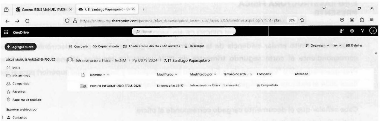
Imagen 1: Carpeta compartida PRIMER INFORME (2DO TRIM. 2024